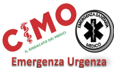
Figura e Carriera del medico specialista in Emergenza-Urgenza

Ordine dei Medici Chirurghi Via Giulio Cesare Vanini, 15 Firenze